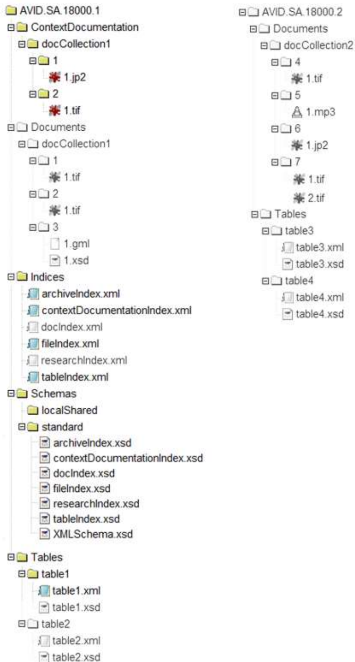
Figur 2.2 Placering af skemaer fra OGC til validering af GML version 3.1.1

Elementer, som ikke er gråmarkerede, er obligatoriske i en arkiveringsversion.